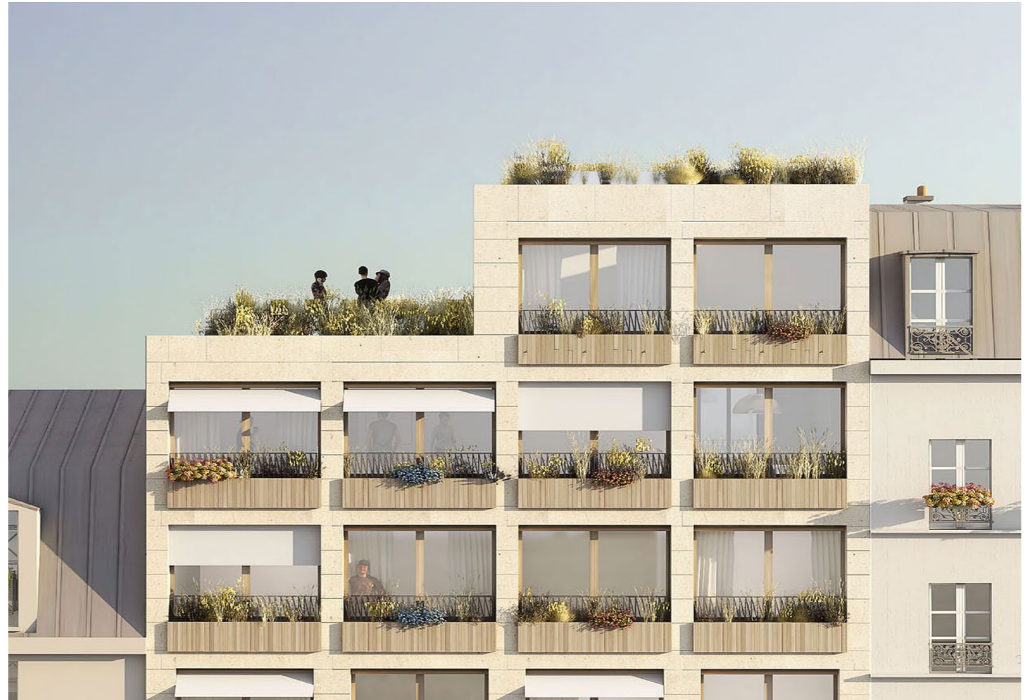
MOBILE ARCHITECTURAL OFFICE