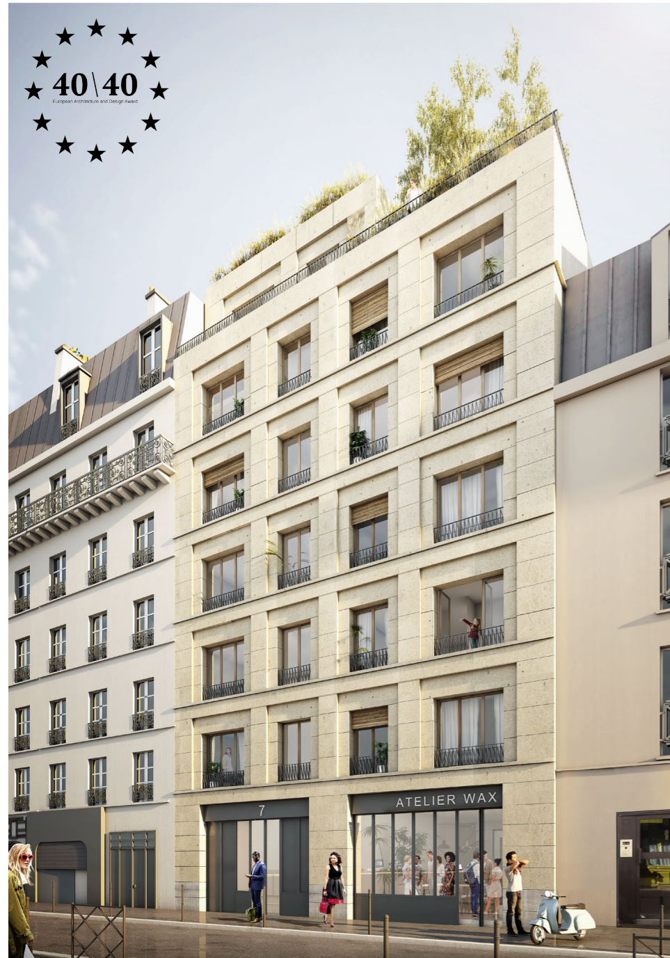
77 - HABITAT